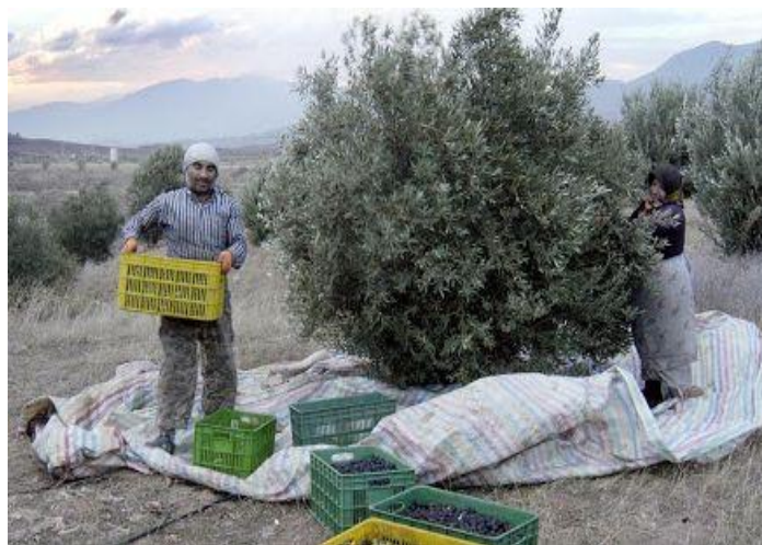
شکل ۲- برداشت صحیح زیتون در سبدهای پلاستیکی

زیتون جزء درختان سال‌آور است. به عبارت دیگر، درخت زیتون یک سال پربار و یک سال کم‌بار میوه می‌دهد. پدیده سال‌آوری علاوه بر تولید نامنظم محصول در سال‌های مختلف، سبب کاهش کیفیت میوه در سال پرمحصول می‌شود. میوه‌های رسیده زیتون را بهتر است در سبدها و جعبه‌های پلاستیکی جمع‌آوری کرد و از ریختن میوه زیتون در کیسه‌های پلاستیکی جلوگیری شود تا میوه دچار صدمه مکانیکی و لهیدگی نشود (شکل‌های ۲، ۳ و ۴). اصولاً میوه زیتون توسط دست برداشت می‌شود که معمولاً مستلزم استفاده از تعداد زیادی کارگر فصلی است و به کندی انجام می‌گیرد. برای چیدن میوه با دست، کارگر از درخت بالا می‌رود و میوه‌ها در سبد دستی جمع‌آوری می‌شود و اگر درخت خوب هرس شده باشد می‌توان به راحتی میوه را با دست برداشت کرد که مناسب مصارف کنسروی است.