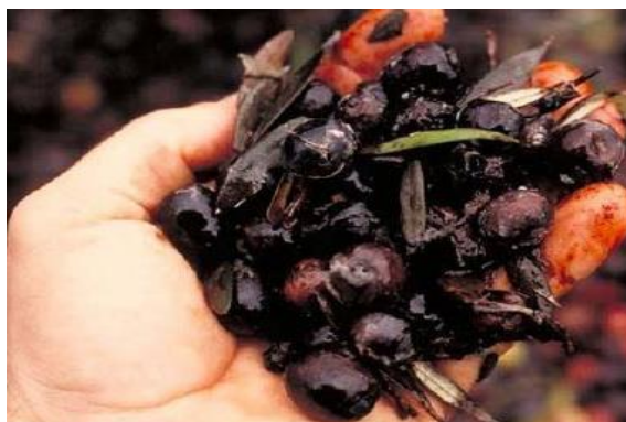
شکل ۷- فساد و کپک‌زدگی زیتون در شرایط نامساعد نگهداری