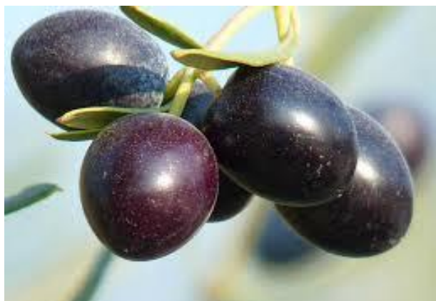
شکل ۱- زیتون رسیده برای استحصال روغن

زیتون جزء درختان سال‌آور است. به عبارت دیگر، درخت زیتون یک سال پربار و یک سال کم‌بار میوه می‌دهد. پدیده سال‌آوری علاوه بر تولید نامنظم محصول در سال‌های مختلف، سبب کاهش کیفیت میوه در سال پرمحصول می‌شود. میوه‌های رسیده زیتون را بهتر است در سبدها و جعبه‌های پلاستیکی جمع‌آوری کرد و از ریختن میوه زیتون در کیسه‌های پلاستیکی جلوگیری شود تا میوه دچار صدمه مکانیکی و لهیدگی نشود (شکل‌های ۲، ۳ و ۴). اصولاً میوه زیتون توسط دست برداشت می‌شود که معمولاً مستلزم استفاده از تعداد زیادی کارگر فصلی است و به کندی انجام می‌گیرد. برای چیدن میوه با دست، کارگر از درخت بالا می‌رود و میوه‌ها در سبد دستی جمع‌آوری می‌شود و اگر درخت خوب هرس شده باشد می‌توان به راحتی میوه را با دست برداشت کرد که مناسب مصارف کنسروی است.