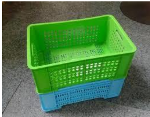
شکل ۳- سبدهای پلاستیکی مناسب برداشت زیتون شکل ۴- جمع آوری نادرست زیتون در کیسه

در بعضی مناطق، برداشت میوه زیتون از روی درخت به کمک تیر چوبی بلند صورت می‌گیرد که این روش نه تنها میوه زیتون را معیوب کرده بلکه موجب شکسته شدن شاخه‌های بارده و در نهایت، منجر به کاهش محصول سالیانه درخت در حدود ۱۰ کیلوگرم نیز می‌شود. شایان ذکر است که با چیدن میوه زیتون با چوب، میزان اسید چرب آزاد و میزان پراکسید افزایش می‌یابد. در روش دیگر برداشت، از شانه‌های با دسته چوبی بلند استفاده می‌شود که این روش خسارت زیادی به سرشاخه‌های جوان می‌زند. اخیراً برداشت میوه زیتون به صورت مکانیکی و توسط دستگاه‌های لرزاننده صورت می‌گیرد که ضمن سرعت بالا، افزایش بهره‌وری، حفظ کیفیت مطلوب محصول، نیاز به کارگر نیز ندارد (شکل ۵). لازم به ذکر است روش برداشت بر حسب منطقه، ارقام زیتون، سیستم هرس و ترتیب درختان زیتون متفاوت است. نکته حائز اهمیت این است که در هر روش برداشت زیتون، نهایت دقت به عمل آید تا میوه و درخت دچار صدمه و ضربات مکانیکی نشوند. آسیب‌های مکانیکی وارد شده به محصول در حین برداشت، سبب تهاجم میکروارگانیسم‌ها و تسریع در فساد روغن و کاهش ارزش اقتصادی و درجه کیفی آن خواهد شد.