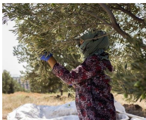
شکل ۵- روش‌های مختلف برداشت زیتون

(برداشت با دست، برداشت با تیر چوبی بلند، برداشت مکانیکی با لرزاننده)