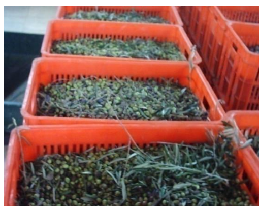
شکل ۸- نگهداری زیتون در سردخانه