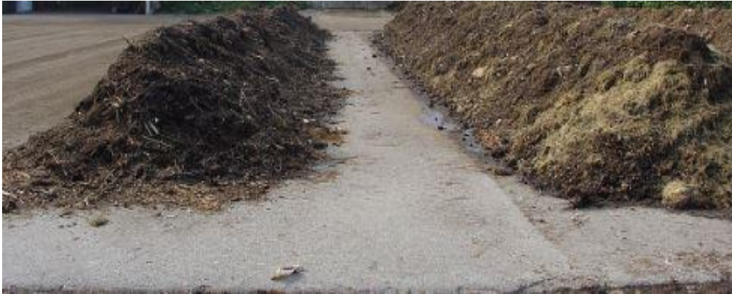
شکل ۲- آماده سازی محل و چگونگی انباشت توده اولیه (پشته گذاری)