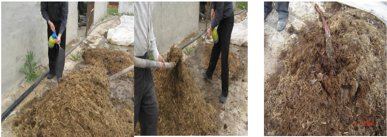
اضافه کردن باکتری ازتوباکتر

ازتوباکتر را اضافه کرده و تلنباره‌ها را در دو نوبت زیر و رو کنید. میزان مصرف قارچ و باکتری، ۲/۵ کیلوگرم به ازاء هر تن ماده خام است (شکل ۵).