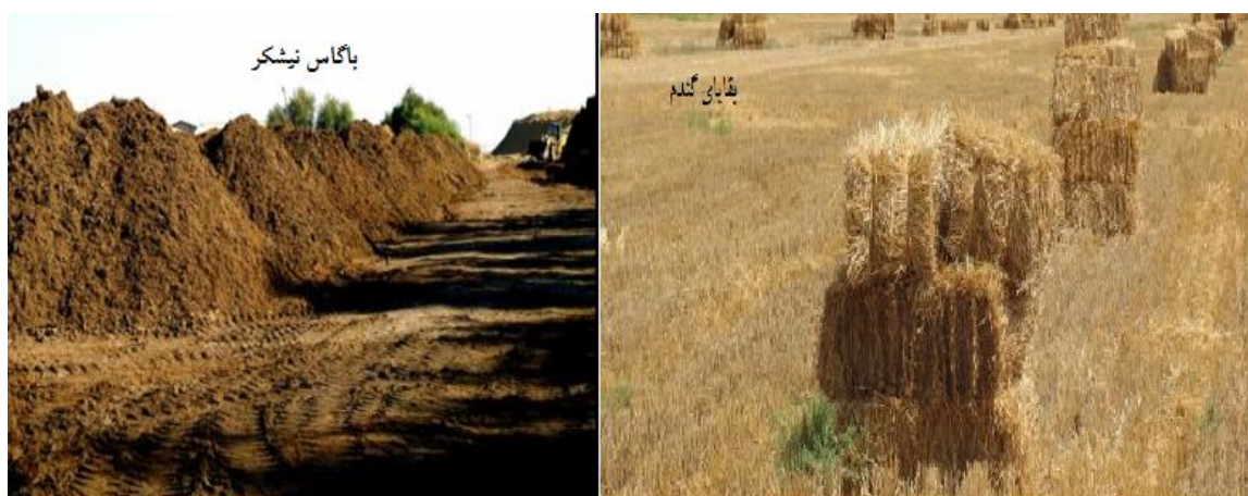
شکل ۱- وضعیت فراوانی بقایای گندم و نیشکر در استان خوزستان

ماده خام اولیه برای تهیه کمپوست براساس فراوانی، قیمت و قابل دسترس بودن انتخاب می شود. با توجه به شرایط کنونی استان خوزستان، دو ماده آلی باگاس نیشکر و کاه و کلش گندم، دارای این شرایط هستند (شکل ۱). فیلترکیک نیشکر به فراوانی باگاس نیست (تقریباً یک چهارم آن). فیلترکیک نیشکر در اراضی بایر اطراف کارخانه های نیشکر رها می شود. این ماده، ارزش غذایی بالایی دارد. بنابراین، فیلترکیک می تواند مکمل خوبی برای تولید کمپوست باشد. فضولات گاوی نیز علی رغم محدودیت فراوانی، به دلیل ارزش غذایی زیاد، می توانند مکمل مناسبی باشند.