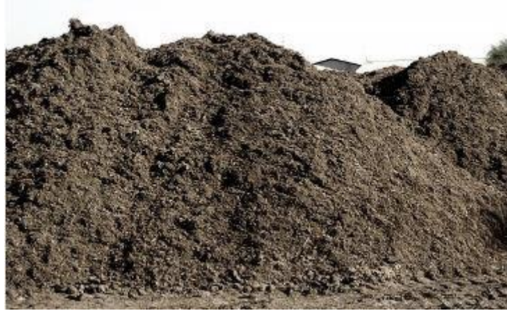
شکل ۷- مراحل نهایی کمپوست رسیده