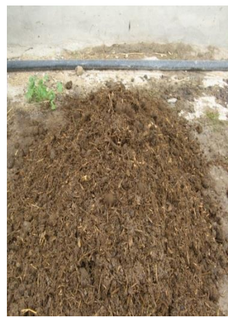
تهیه حجم اولیه تلباره

شکل ۳- مخلوط سازی اولیه برای تولید بیوکمپوست