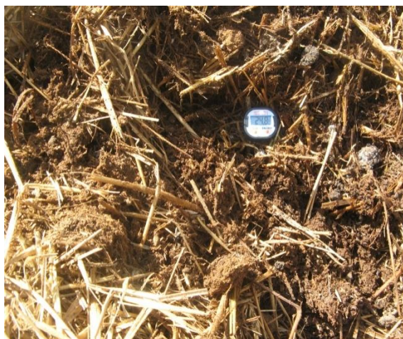
شکل ۶- کنترل دمای تلباره