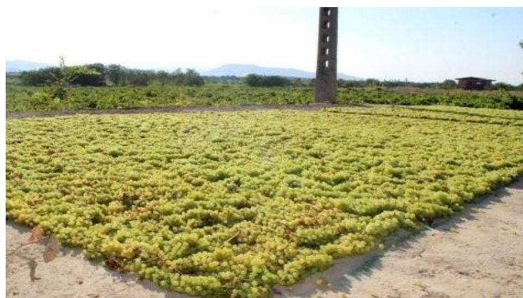
شکل ۱- خشک‌کردن انگور در ورزن

کشمش یکی از محصولات ارزآور در بخش کشاورزی است. در ایران چالش‌های متعددی در افزایش کمی و کیفی کشمش حاصله و عرضه و رقابت در بازارهای داخلی و خارجی وجود دارد. از مسائل مهم در تولید کشمش در کشور می‌توان به عدم استفاده از بارگاه‌های بهداشتی، عدم بسته‌بندی مناسب، وجود ضایعات و آلودگی میکروبی و در نهایت، عدم استاندارد کیفی و بهداشتی جهانی مناسب در کشمش اشاره کرد. در کشورهای در حال توسعه، خشک‌کردن انگور به‌طور سنتی در برابر نور خورشید (در هوای آزاد) صورت می‌گیرد. در ایران، انگور اغلب در قطعه زمینی از تاختستان به نام "ورزن" خشک می‌شود. ورزن‌ها معمولاً دارای سطح شیب‌دار با پوشش کاه‌گلی و در بعضی موارد، دارای سطح با پوشش سیمان، آسفالت و غیره هستند. شیب ورزن حدود ۵ درصد است و برای بهره‌مندی بیشتر از نور خورشید، جهت آن به طرف جنوب قرار دارد (شکل ۱). این روش خشک‌کردن، علی‌رغم سادگی و نیاز به سرمایه‌گذاری کم، دارای معایبی است. از جمله این معایب می‌توان به عدم توانایی کنترل صحیح عملیات خشک‌کردن، زمان طولانی برای خشک‌کردن، نیاز به مساحت زیاد و خطر آلودگی با کپک‌ها و حشرات اشاره کرد. از طرفی، به علت کمبود بارگاه‌های بهداشتی و مسقف و ترس از مواجهه‌شدن انگور موجود در بارگاه‌های سنتی با باران‌های پاییزه و بی‌موقع، باغداران اقدام به برداشت زودهنگام محصول می‌کنند. در برداشت زودهنگام انگور، میزان عملکرد و کیفیت کشمش تولیدی به دلیل پایین‌بودن درجه بریکس میوه، کاهش یافته و در پی این روند، تاکداران متضرر می‌شوند. درجه بریکس انگور در زمان برداشت علاوه بر عملکرد کل، نقش مهمی نیز در بازیابی کشمش دارد.