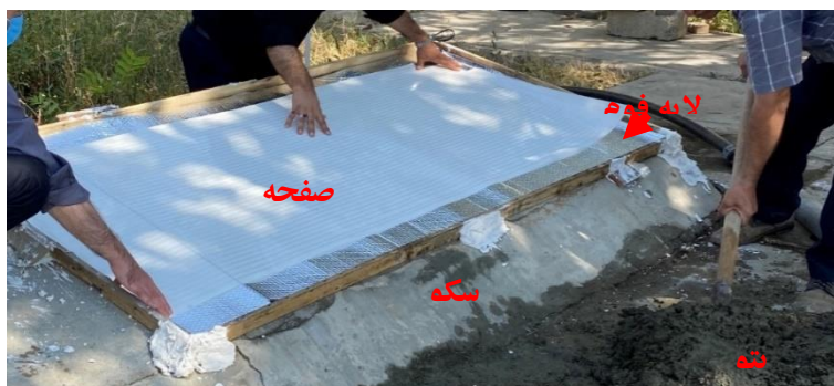
شکل ۳- نصب صفحات گرمایشی هوشمند روی سکو