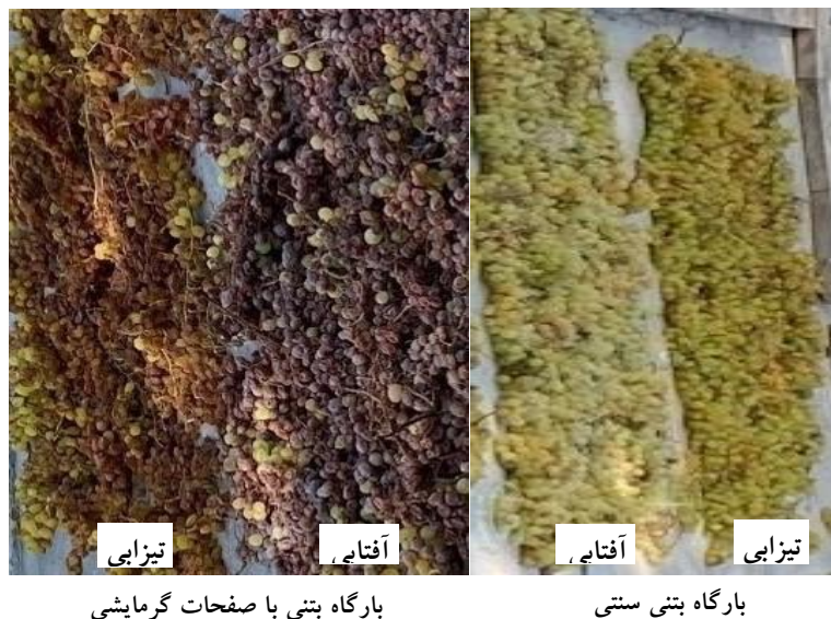
شکل ۵- انگور در بارگاه با صفحات گرمایشی هوشمند در مقایسه با بارگاه سنتی سریع تر خشک می شود.