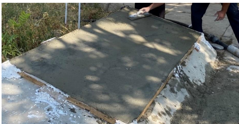
شکل ۴- پوشش دادن بارگاه با صفحات هوشمند با بتن